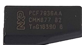
PCF7936 VIRGEM (T19)