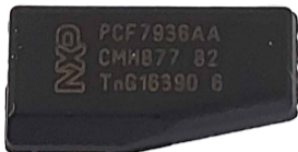
PCF7936 VIRGEM (T19)